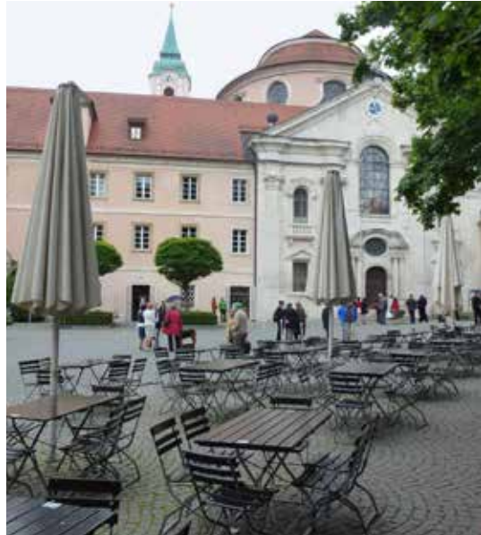
Weltenburger Biergarten mit Barock

Mit etwas Glück geht die Tour 2016 womöglich in die 2. Auflage, und ich möchte an dieser Stelle an Euch alle, liebe Fidelias, appellieren, Wanderfahrten durch Teilnahme zu unterstützen bzw. mit zu organisieren und zu gestalten. Ihr werdet erstaunt sein wie schön es ist, nicht nach 2,5 km immer wenden zu müssen!