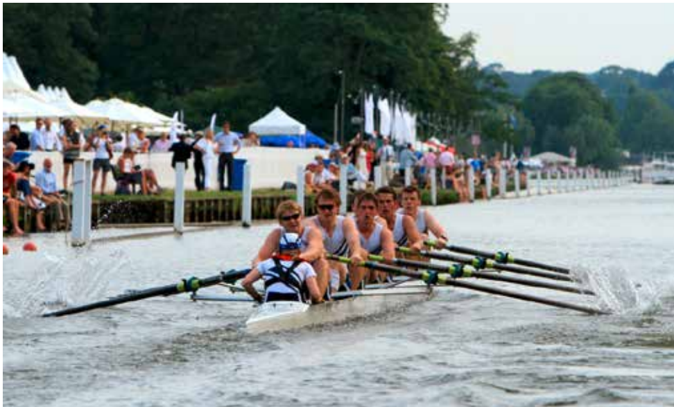
Startphase des Rennens beim Thames Challenge Cup

Nach der Eingewöhnungsphase kam mein erster Einsatz etwas unverhofft. Ich durfte als Ersatzmann im ersten Achter bei einem Head Race (Langstrecke) in London ins Boot steigen. Da die Themse in diesem Bereich noch starken Gezeiten unterliegt haben die Rudervereine dort keine Anlegestellen sondern betonierte Rampen die ans Wasser führen. Ganz stilecht legt man dann mit Gummistiefeln ab und an, was dazu führt, dass die ohnehin schon kalte Veranstaltung noch unangenehmer wird, weil es kaum zu vermeiden ist nass zu werden. Ich war an diesem Tag hin und weg und muss wie ein