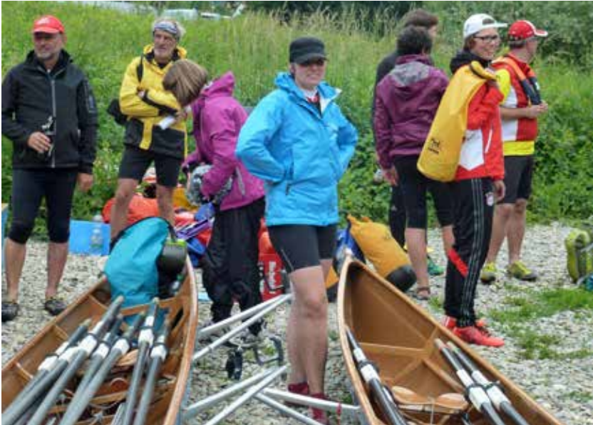
Allseitige Vorfreude aufs Einkehren

der ältesten Klosterbrauerei der Welt mehr als willkommen!