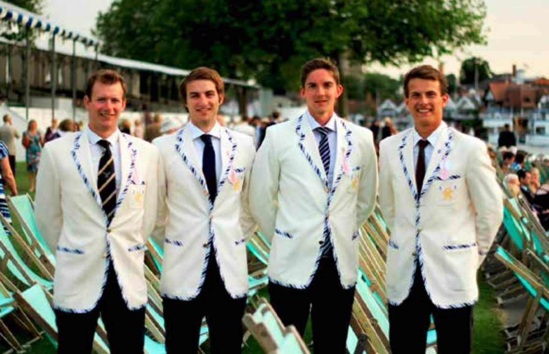
Stewards Enclosure auf der Henley Royal Regatta – der Dresscode hat Tradition

Neckar hatte ich von vorne herein erwartet. Meine Erwartungen sollten allerdings im Laufe der Saison noch mehrfach übertroffen werden. Zwei Tage nach meiner Ankunft hatte ich meine erste Einheit im Ruderverein. Nach einer kurzen Vorstellungsrunde wurde ich direkt in den planmäßigen 2000 Meter Ergo Test integriert und prompt genau so angefeuert als wäre ich schon immer dabei. Dieses Gefühl kann man direkt auf alles übertragen was ich im Reading Rowing Club (RRC) erlebt habe. Mir wurde viel Vertrauen entgegen gebracht, obwohl ich bisher nur wenig im Riemenbereich gerudert hatte. Die Umstellung von meinem Trainingspensum in Tübingen auf das in Reading war anfangs ein wenig