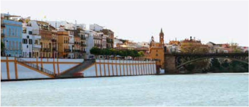
Die Trainingsstrecke mit Blick auf Sevillas Altstadt

rennen in Henley. Das Ziel war klar, der Weg auch.