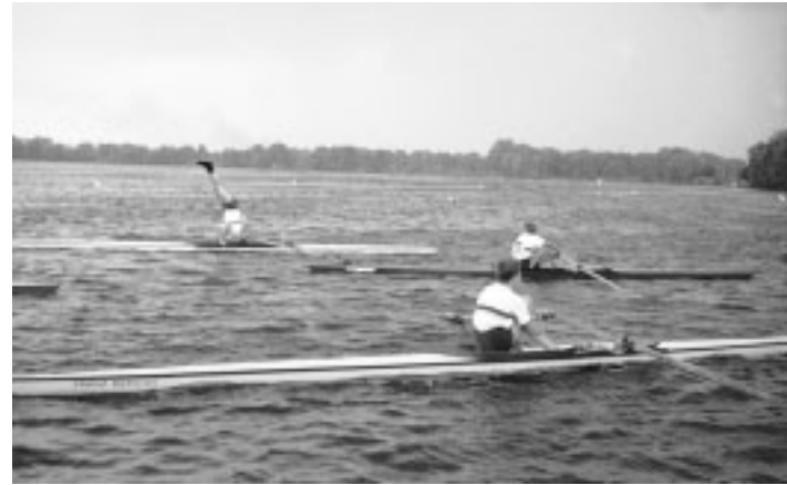
Geschicklichkeitsübungen bei einer Regatta

TRV, setzte die neue Methode und die neue Technik konsequent in der Praxis ein.