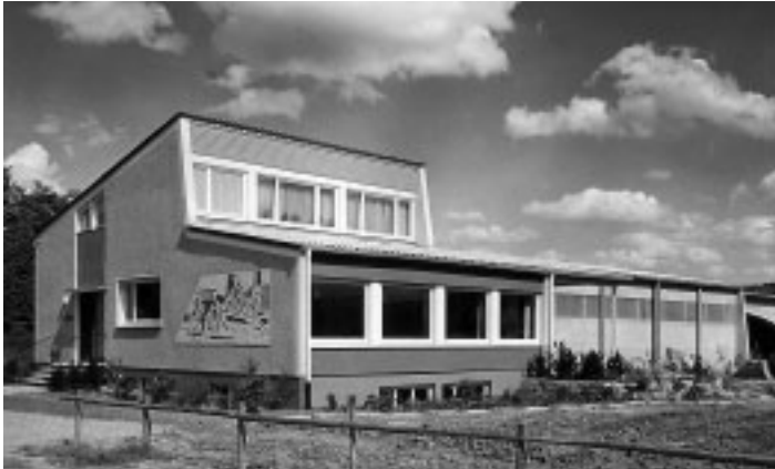
Neues Bootshaus, Gartenstr. 180, erbaut 1960–62