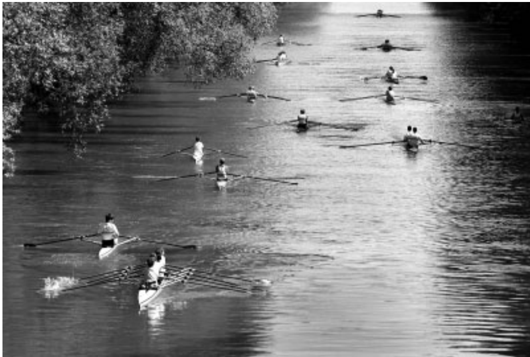
Bootsaufahrt beim Jubiläum 2002

Der Tübinger Ruderverein „Fidelia“ feiert sein 125. Jubiläum.