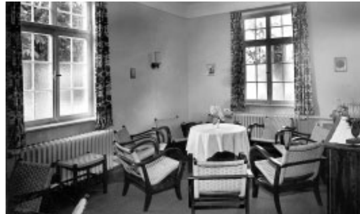
Clubraum altes Bootshaus, 1952