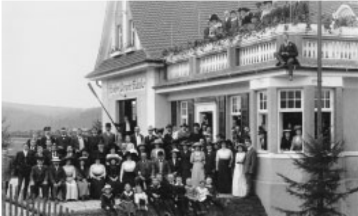
Altes Bootshaus, Bismarckstr. 30, erbaut 1912/13