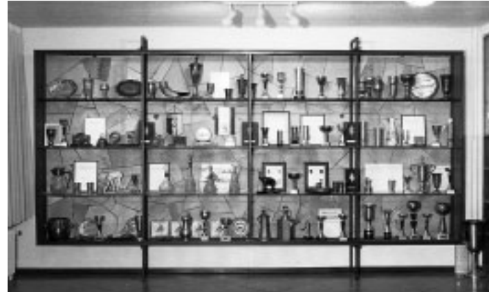
Einbau des Pokalschranks, 1992