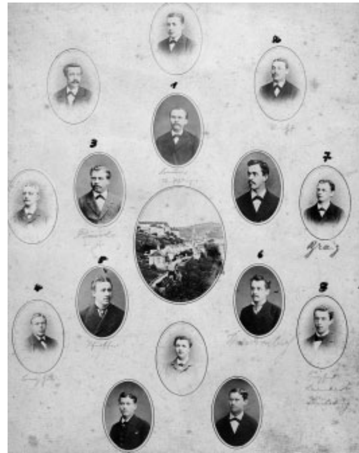
Ahnentafel der Fidelia

beteiligte sie sich an den Veranstaltungen des Sängerkranzes, zu dem sie in freundschaftlichen Beziehungen stand. Ebenso bestand ab 1892 eine Freundschaft mit dem Reutlinger Verein „Fidelio“, der wohl ein ähnliches Gebilde wie die Fidelia war, nur weniger er-