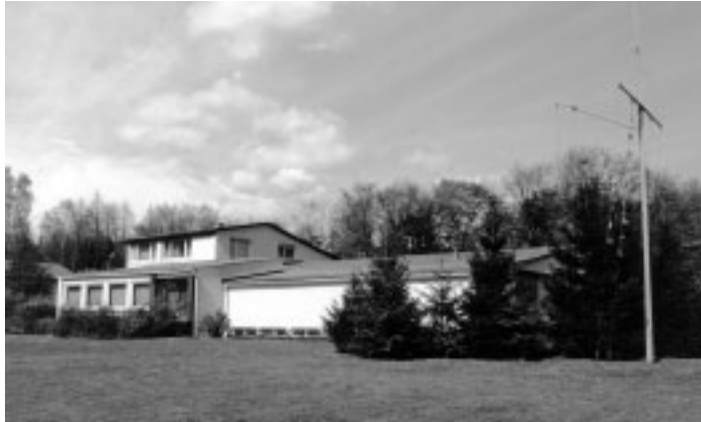
Anlegen der Terrasse und Aufstellen des Fahnenmastes, 1976

1982 , Anbau der Garage für Bootsanhänger und Zugfahrzeug (heute Bootshalle bzw. „Hasenstall“)