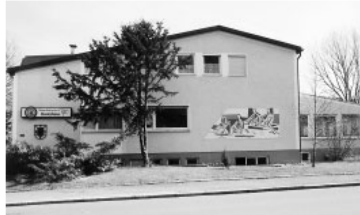
Haus- und Bootshallenerweiterung, 1969/70