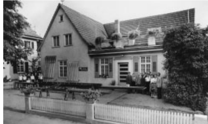
Nach dem 2. Weltkrieg wiederaufgebautes altes Bootshaus, 1947