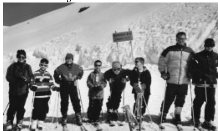
Skifreizeit im Bregenzer Wald

Unsere Jugendarbeit beschränkt sich nicht nur auf den ruderischen Teil, sondern es gibt auch ein breites Angebot an anderen Aktivitäten. So fahren wir im Winter nach dem Samstagstraining schon mal ins Badkap, um uns im Wasser auszutoben. Im Sommer fördern Grillfeste den Gemeinschaftssinn. Eine völlig neue Sache war unsere Skifreizeit im Bregenzer Wald in den Osterferien. Wir waren eine Gruppe mit sehr unterschiedlichem Leistungsvermögen, aber durch eine flexible Teilung der großen Gruppe kam jeder voll auf seine Kosten und niemand wurde ausgegrenzt. Neu war auch die gemeinsame Paddeltour mit der Gesundheitssportgruppe am 1. Mai. Mit fünf Booten paddelten wir von Börstingen nach Rottenburg. Auch hier kam die Gemeinschaft voll zum Tragen, und so konnten wir schwierige Situationen gut meistern. Eine der größten Aktionen war sicherlich