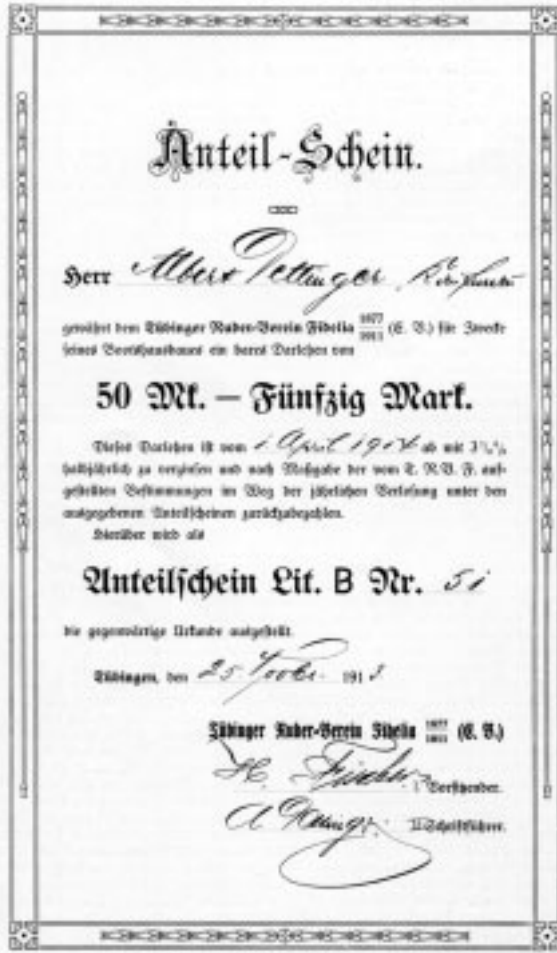
Anteilschein zur Bootshausfinanzierung

Aufschluß geben könnten, so daß man hier auf Vermutungen angewiesen ist. Dennoch ist eine Aussage möglich. Es wurde bereits festgestellt, daß es den ersten Fidelityern 1877 wichtig war, sich gesellschaftlich in Tübingen einzuführen und ihr Renommee zu heben. Wahrscheinlich war ein solches Prestigedenken auch 1910/11 noch vorhanden und beeinflusste die Entscheidung für die Sportart Rudern. Denn der Rudersport unterschied sich vom Fußball gerade dadurch, daß er stärker anerkannt war in der Gesellschaft. Wenn auch der 1. FC Tübingen 1910 großen Zulauf hatte, war der Fußball doch umstritten. Er wurde besonders von den Turnern erbittert bekämpft, die den damals noch recht rauhen Sport als „Fußflümmelei“ und „englische Krankheit“ abqualifizierten. Auch wurde den Fußballern vorgeworfen, sie seien vaterlandslose Gesellen, ganz anders als z. B. die Turner, die Sport für das Vaterland betrieben. Der Rudersport dagegen wurde im Kaiserreich von höchster Stelle gefördert, so schon durch Kaiser Wilhelm I., der z. B. 1883 dem Berliner Regatta-Verein einen Wanderpreis stiftete, und noch mehr durch Kaiser Wilhelm II., der die Grünauer Regatta zu einem großen sportlichen und gesellschaftlichen Ereignis in Berlin machte und dem der Rudersport gut in seine Flottenpolitik paßte.