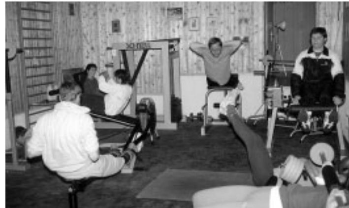
Umbau des Ruderbeckens zum Kraft-/Festraum, 1968