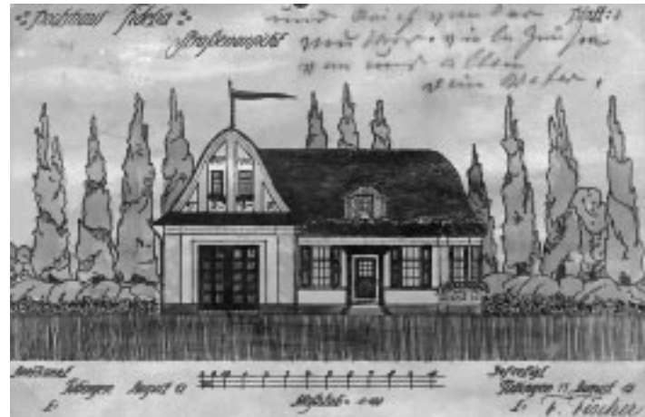
Plan für das Bootshaus, 1912

Im Jahr 1912 mußte ein dringendes Problem gelöst werden: die Unterbringung der Boote und der Anlegeplatz. Es wurden viele Pläne gemacht und viele Standorte bedacht, bis schließlich die Stadt Tübingen dem TRV entgegenkam und ein Grundstück in der Bismarckstraße dem Verein zu einem günstigen Preis überließ. Das Geld für den Bauplatz und das Bootshaus selbst wurde von den Mitgliedern durch Anteilsscheine erbracht, d. h., die Mitglieder liehen dem Verein das nötige Geld zu einem moderaten Zins von 3,5 %. Im Oktober 1912 wurde Richtfest gefeiert und vom 10.–12. März 1913 (drei Tage!) die Einweihung. Im Jahr 1913 erhalten die Tübinger Ruderer nochmals Hilfe vom Ludwigshafener RV. Olympiasieger Wilker erteilt ihnen Ruderunterricht, so daß sich im Frühjahr 1914 zwölf mutige TRVler zum Training verpflichten. Allerdings, so berichtet Otto Bender („Der Ruderer“, Nr. 7, 1925, S. 1), fällt hier noch einmal der Wechsel von der Gesellschaft Fidelia zu einem Ruderverein schwer, denn es gibt heftige Diskussionen über die strengen Trainingsbestimmungen, besonders das Al-