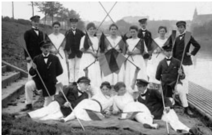
Der Gala-Anzug der ersten Ruderer

In einer Ausschußsitzung am 9. Juni 1911 wurde das äußerliche Auftreten des TRV festgelegt, mit der „Flagge mit weißem Feld in der Mitte Tübinger Stadtwapen und gez. T.R.V.F. 1877-1911“ , und der „Sportsanzug“ zusammengestellt: „dunkelblaue Hose, weiße Ruderjacke, weißes Sweater, dunkelblaue Mütze mit gelb-rottem Passepoil, schwarze Strümpfe, braune Segeltuchschuhe“ (Protokollbuch, 9. Juni 1911).