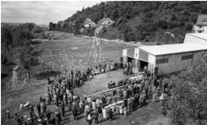
Einweihung des neuen Bootshauses, 7. Mai 1961